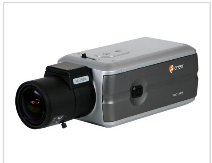
Das Objektiv gehört nicht zum Lieferumfang