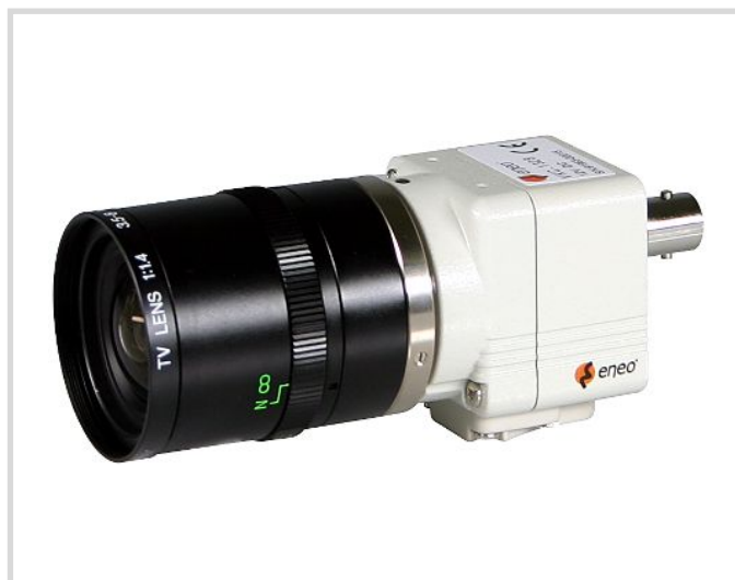
Das Objektiv gehört nicht zum Lieferumfang